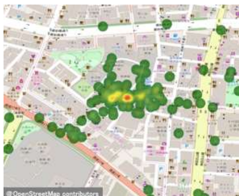
〈人の滞留の可視化〉